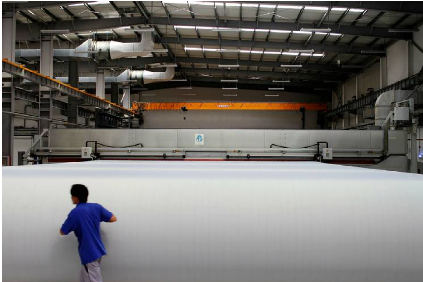
En strekk- og varmebehandlingsmaskin fra Alfsen og Gunderson er levert til Anhui Taipingyang i Taihe, nordvest for Shanghai.

Metoden lå i at Alfsen og Gunderson ga en selgerkreditt på kontraktssummen som Eksportkreditt så kjøpte. Den kinesiske kunden gis et lån som nedbetales over fem år med en svært gunstig effektiv rente, på 1,83 prosent.