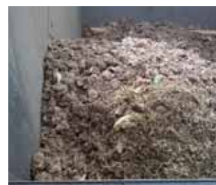
Avfallet från en WSP skruvpress har en torrhalt på över 50%.