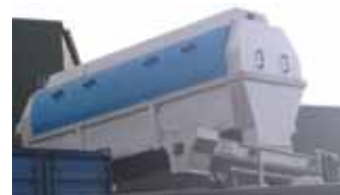
En WSP-260 skruvpress kopplad till en RotoSieve® RS-416 Trumsil ger optimal avskiljning av rens.

Pressenheten är utrustad med en inspektionsslucka för att underlätta underhållet och möjliggöra spolning av pressröret. Som standard tillverkas enheten i rostfritt stål (1.4301) eller (1.4436) med slitjärn i LDX. Den nya utformningen minimerar friktionen mellan spiralen och slitjärnen genom att utnyttja det komprimerade rensat som bärare, vilket lyfter spiralen till ett centrerat läge. Spiralen tillverkas som standard av svart material (S355J0) men kan även levereras i rostfritt stål.