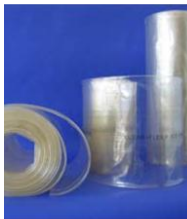
Clear –Flex SDX

Kan også levers etter kundens dimensjoner