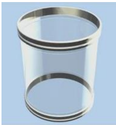
BFM® – tilkopling med 040 Seeflex (klar polyuretan)