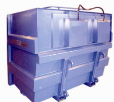
BEAF Frontlaster container Innebygget fallkammer Sidemonterte planfilter 2-5 m 3