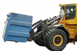
BOF BM Fallkammer Frontlaster 5 m 3