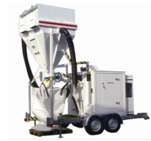
SDW-3,5T På henger Utmating til Big-Bag 45 kW