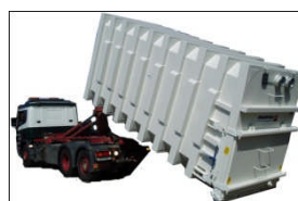
BOL Fallkammer Lasteveksler container 8 - 12 m 3