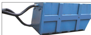
BOD Fallkammer Liftdumper container 6 - 10 m 3