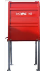
BagVac Kran / gaffeltruck Utmating Big-Bag 12,5 - 16,5 kW