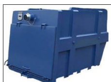
BEAD Liftdumper container Innebygget fallkammer Sidemonterte planfilter 4 - 6 m 3