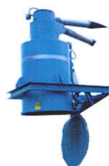
BO Serien Fallkammer / syklon Spjeld / kammersluse eller stor luke 0,5 – 5 m 3