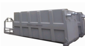
BEAL Lasteveksler container Innebygget fallkammer Sidemonterte planfilter 2 - 5 m 3