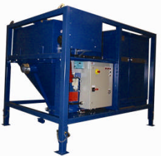
SEBF-II Kran / gaffeltruck Utmating til container / Big-Bag 30-75 kW