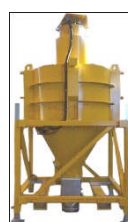
BOC-800 mbar Fallkammer / syklon Flyttbar med gaffeltruck 1 - 2 m 3 - Big-Bag