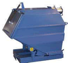
BOFV Fallkammer Gaffeltruck 0,7 – 2 m 3