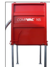
CompVac Kran / gaffeltruck Utmating via stor luke i siden 12,5 - 16,5 kW