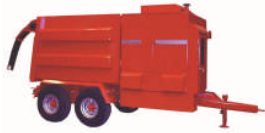
SDT-10T På henger 4,5m 3 volum 30 – 55 kW