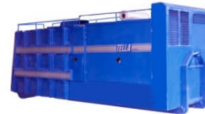
SDL VACLOADER Lasteveksler Utmating via stor luke bak 10 m 3 volum 130-160 kW

Brosjyren viser et utvalg av de vanligste produktene.