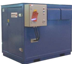
PES-Serien Elektrisk 5,5-160kW 300-800mbar