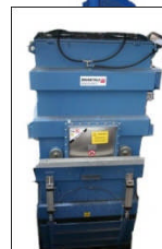
BEATL-SPG Innebygget fallkammer Toppmonterte planfilter Hel bunnluke