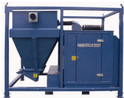
SDBF-II Kran / gaffeltruck Utmating til container / Big-Bag 30 - 55 kW