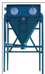
BEAS Innebygget fallkammer Sidemonterte planfilter For container / Big-Bag