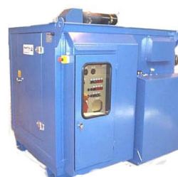
PDS-Serien Diesel 45-160kW 300-800mbar