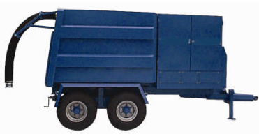
SET-10T På henger 4,5m 3 volum 30 – 55 kW