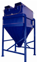
BEAT Innebygget fallkammer Toppmonterte planfilter For container / Big-Bag