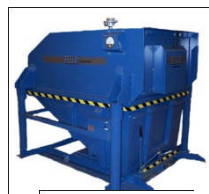
BEASS-SFV Innebygget fallkammer Sidemonterte planfilter Oppsamling tippcont. Pneumatiske ben.