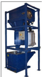
SEBF-I Kran / gaffeltruck Utmating til container / Big-Bag 5,5 - 16,5 kW