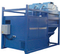
SEBF-III Kran / gaffeltruck Utmating til container / Big-Bag 75-110 kW