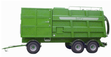
SET-20T På henger 10 m 3 volum 55 – 110 kW