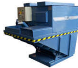
SEFV 13 Gaffeltruck 0,9m 3 volum 12,5 kW