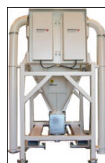
BEAF Conic Gaffeltruck Innebygget fallkammer Sidemonterte planfilter 0,5 - 1,5 m 3 - Big-Bag